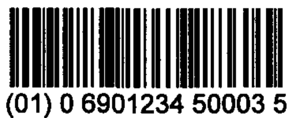
图 C.3 表示 13 位数字代码的 UCC/EAN-128 条码示例