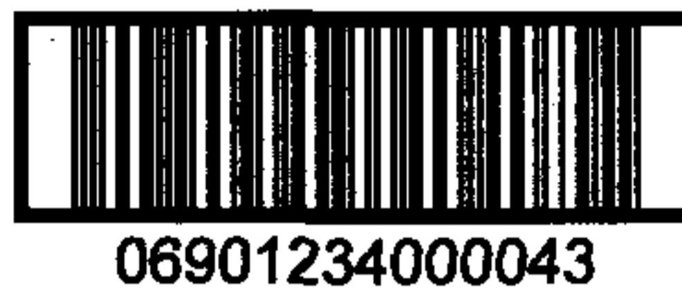
图 C.2 表示 13 位数字代码的 ITF-14 条码示例