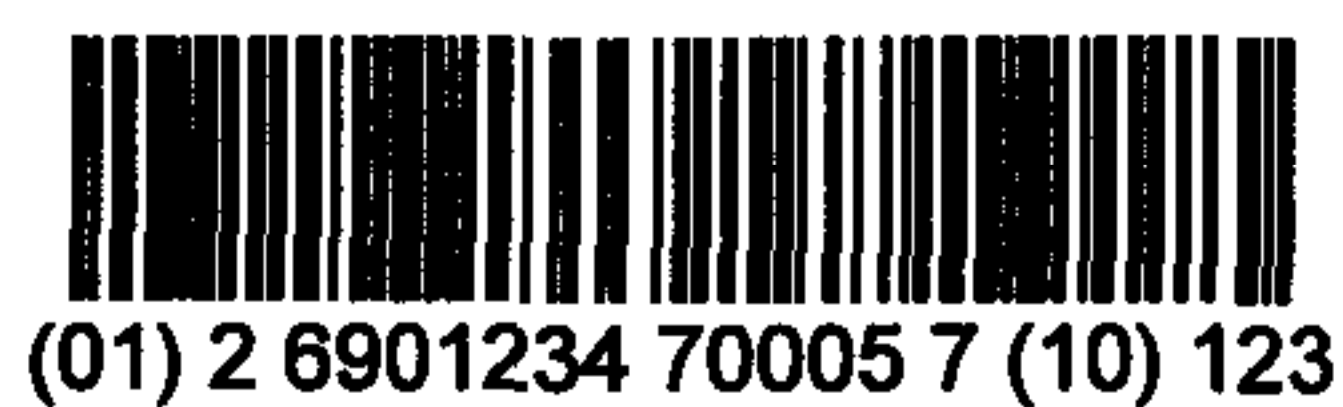
图 C.6 含批号“123”的 UCC/EAN-128 条码示例