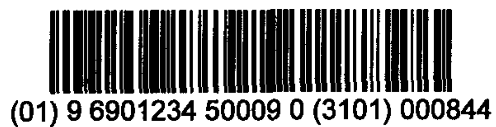
图 C.7 质量是 84.4 kg 的变量储运包装商品的 UCC/EAN-128 条码示例