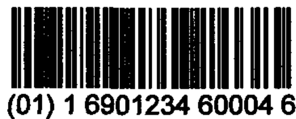
图 C.5 包装指示符为“1”的 UCC/EAN-128 条码示例