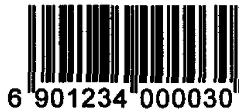
图 C.1 表示 13 位数字代码的 EAN-13 条码示例